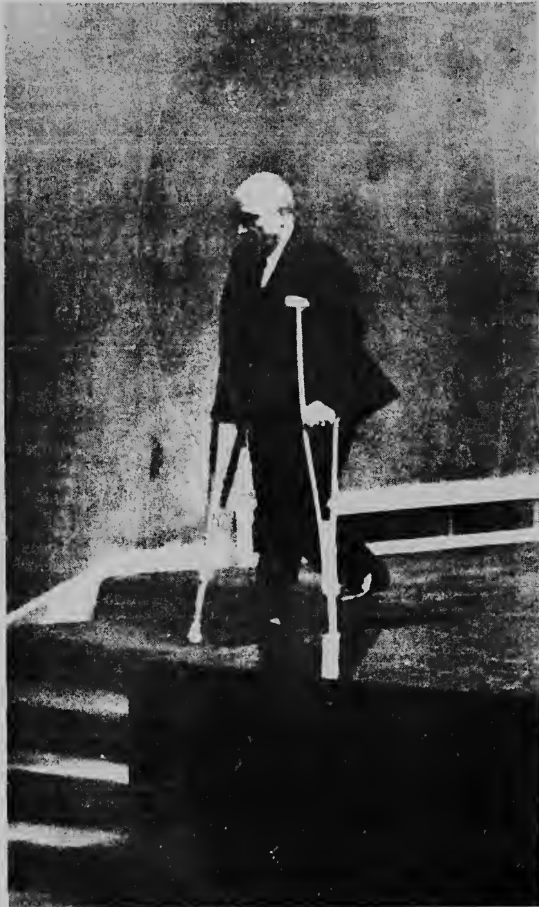
NACCIONNAN UNI -- UPI -- Riba e foto aki nos por mira presidente di Asamblea General di Nacionnan Uni Amintore Fanfani despues di un reunion cu tabatin den seno di Nacionnan Uni. Fanfani ta recuperando di un pia cu el a kibra. Radiophoto UPI.